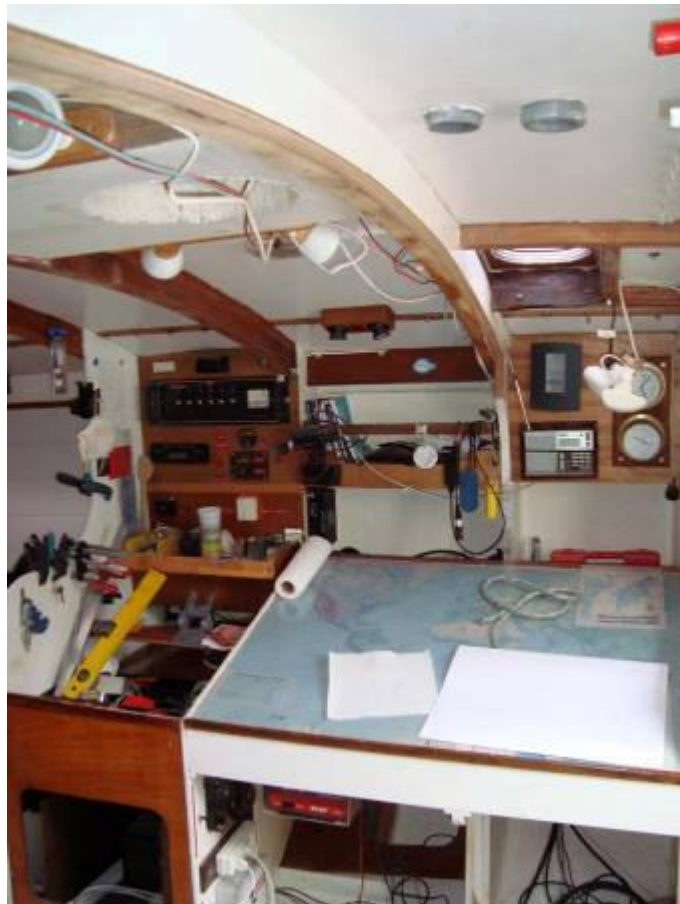
Table à carte d'origine

Situation initiale (après démontage des façades de la cuisine)