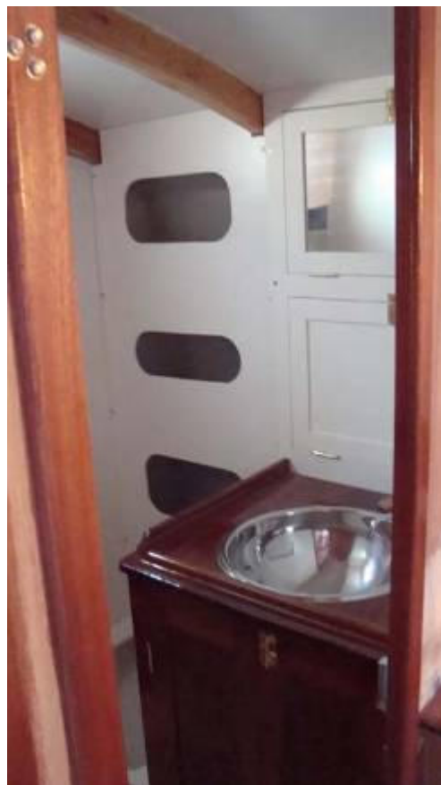
Vue du carré